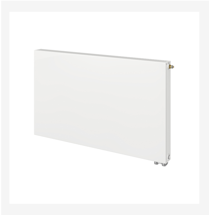
ProductImage - Vonoplan Ventil